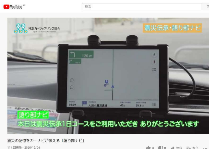
画像 2：語り部ナビの紹介映像